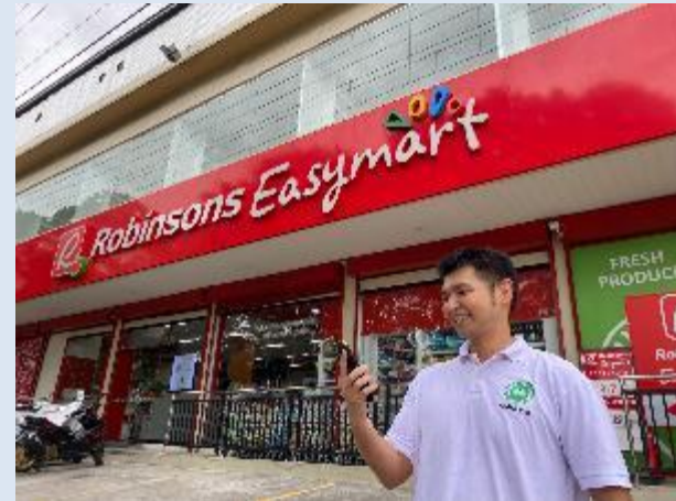
学校から徒歩3分の大型スーパー前にて

学校から車で10分の NEPOモールにて プリペイドロードカード を購入可能。プランは 多々あり、500ペソで 約50GB＝動画を約 80時間視聴可能 (有効期間1ヶ月)。