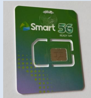
校内売店で販売のSIMカードは約100円