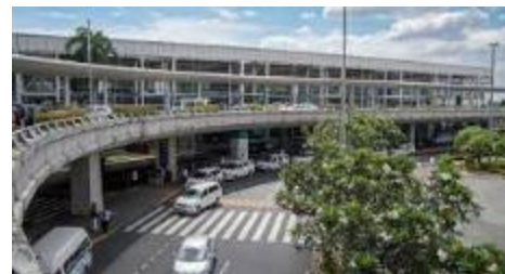
マニラ国際空港 (ターミナル2)

コロナ前までもクラーク⇄マニラ北部間は高速道路が開通していたものの、マニラの中心部にあるマニラ国際空港から高速道路間の渋滞がひどく、マニラ⇄クラーク間は2時間～、渋滞状況によっては4時間かかっていました。その後、2020年に『SKYWAY』という高速道路がマニラ国際空港近くからクラーク間全面開通したことで、現在は安定してマニラ国際空港⇄クラーク間の移動は片道約2時間（最速1時間40分）で可能となっています。